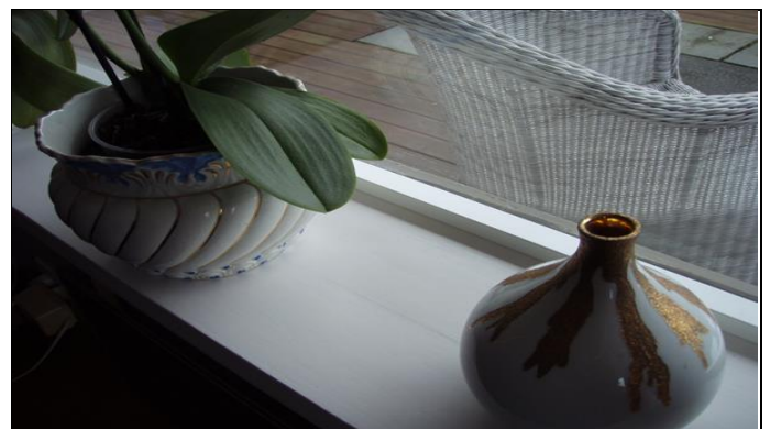
E-025 uten ramme i vinduskarm mot ising og dugg