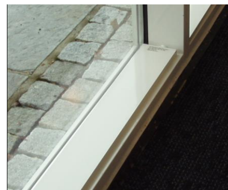
E-050 uten ramme i vinduskarm