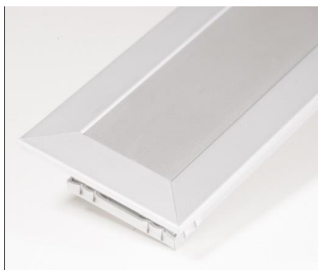
E-050 med ramme