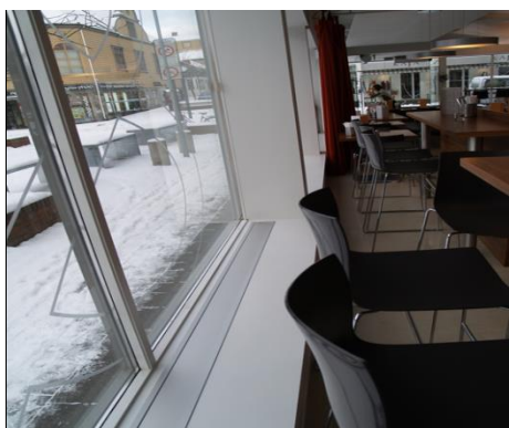
E-050 med ramme nedfelt i vinduskarm

Varmelist uten ramme festes til underlaget med tilhørende festebraketter eller borrelås, evt. felles ned på lik linje med varmelist med ramme, men det kreves da større presisjon når utsparringen lages.