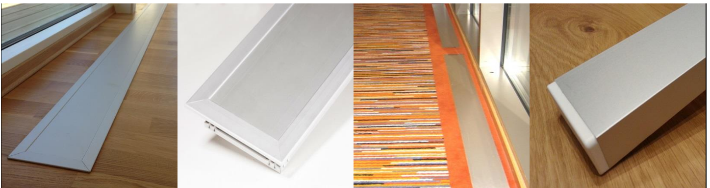
E-100 med ramme nedfelt i parkett

Varmelist uten ramme festes til underlaget med tilhørende festebraketter eller borrelås, evt. felles ned på lik linje med varmelist med ramme, men det kreves da større presisjon når utsparringen lages.