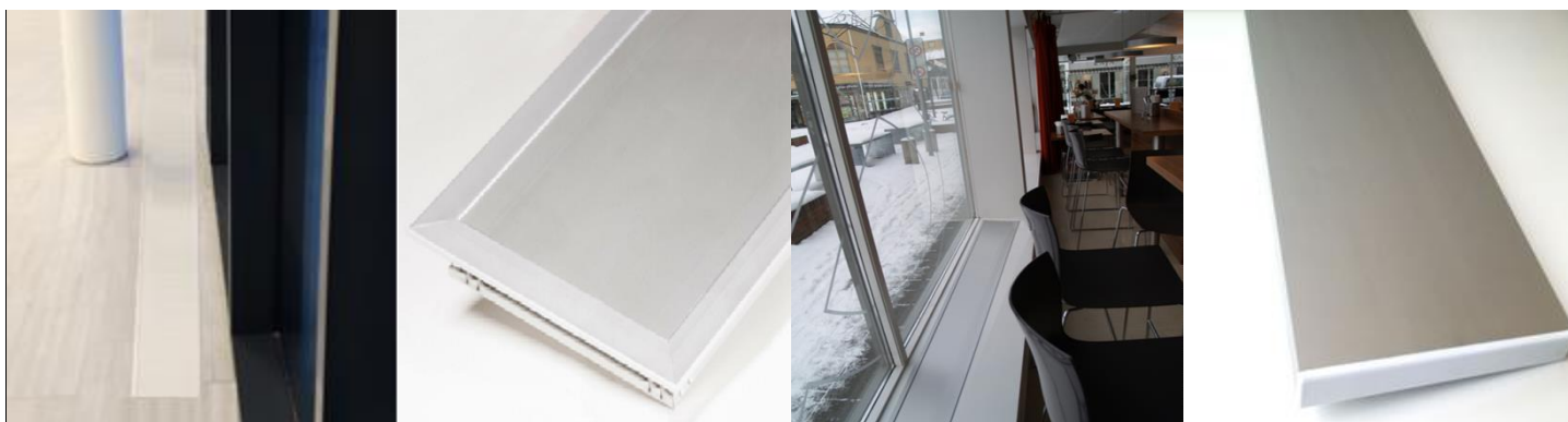
E-200 med ramme nedfelt i marmorfliser

Varmelist uten ramme festes til underlaget med tilhørende festebraketter eller borrelås, evt. felles ned på lik linje med varmelist med ramme, men det kreves da større presisjon når utsparringen lages.